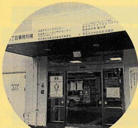
(社福) 世田谷区社会福祉協議会