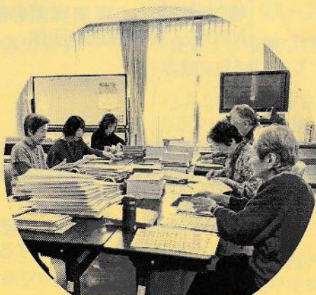
(社福) 世田谷ボランティア協会