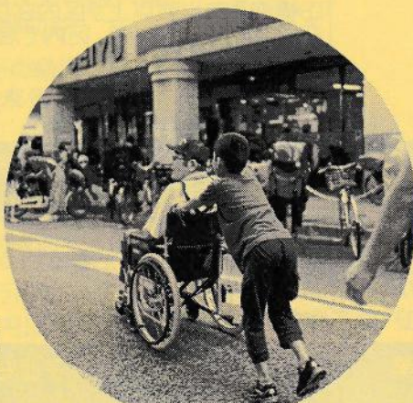
(社福) 世田谷ボランティア協会