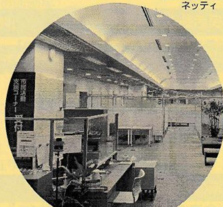
(特非) 国際ボランティア学生協会