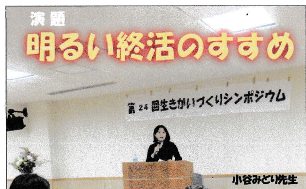
三茶しゃれなあとホール5階 「オリオンルーム」にて