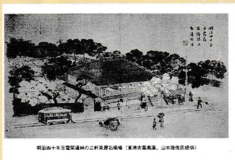
明治四十年玉電開通時の三軒茶屋石種橋 (東清吉富島画)