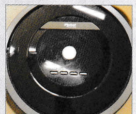
ロボット掃除機 0円