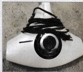
布団クリーナー 0円