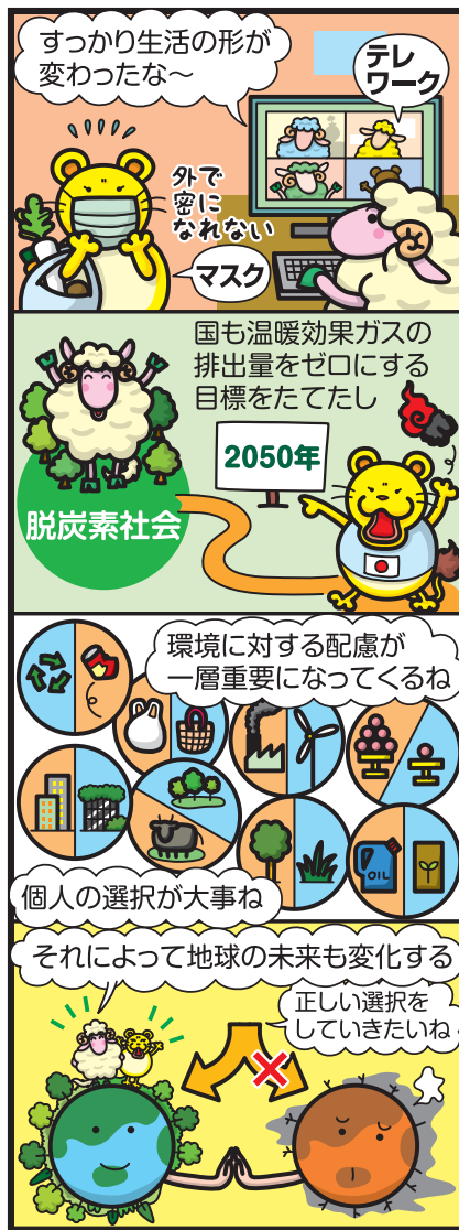
Sheepers!! © KNACKツイン

このまんがのキャラクターがホームページに! 下記のアドレスに遊びに来てね! http://www.knacktwin.com