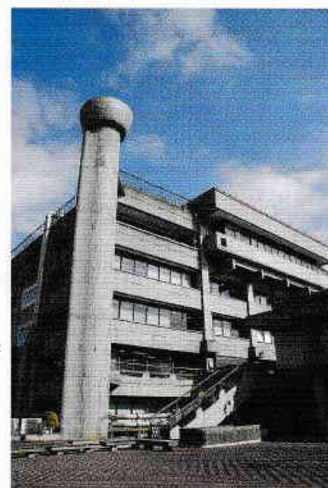
区役所本庁舎

区は、神奈川県三浦市の区有地で「世田谷区みうら太陽光発電所」を開設しました。現在、年間約50万kWhの電力を発電、CO 2 の排出削減は年間約25万kg-CO 2 となっています。この売電収益で「省エネポイントアクション」の参加者に1ポイント1円相当の区内共通商品券を提供します。2か月と3か月の2コースがあり、電気やガスの使用量削減をおこなってまいります。参加登録などの問い合わせは区の環境計画課（電：03-5432-2214、FAX：03-5432-3062）で、登録は6月1日(土)から10月31日(木)まで。